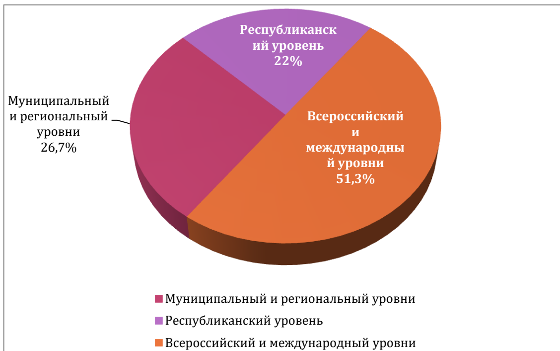
Рис. 1. Соотношение количества побед в конкурсах, соревнованиях различных уровней

В 2023 году 280,2% обучающихся Центра стали победителями в конкурсных мероприятиях различных уровней и завоевали 1907 дипломов (в 2022 году - 1535). Из них 509 дипломов завоеваны на муниципальном и региональном уровнях, 418 дипломов на республиканском уровне, 980 дипломов на всероссийском и международном уровнях. (см. рис. 1).